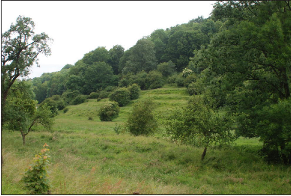
Enfrichement des coteaux de Saint-Wandrille-Rançon.