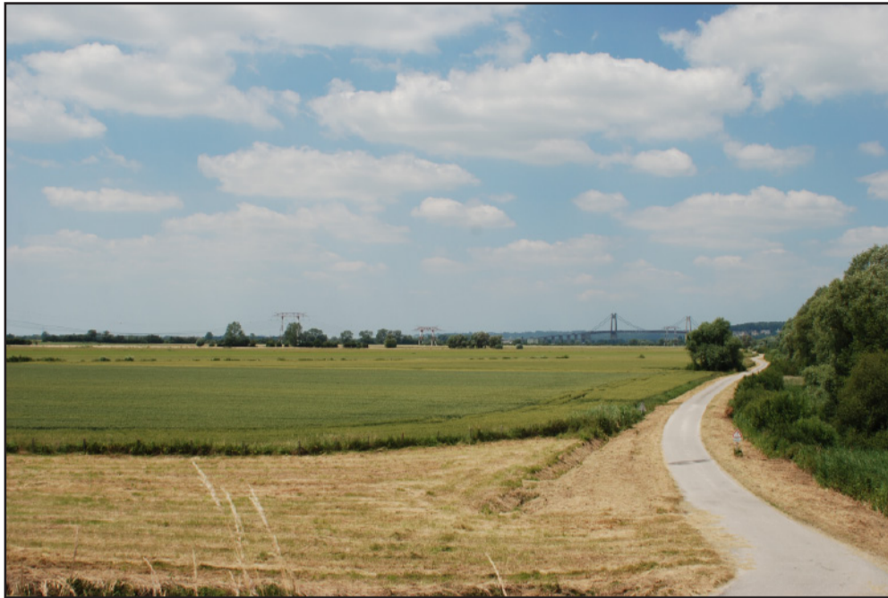
La poldérisation d'une partie du Marais Vernier a converti une grande surface de marais alluvionnaire en champs cultivés. (2009 - commune de Quillebeuf-sur-Seine)