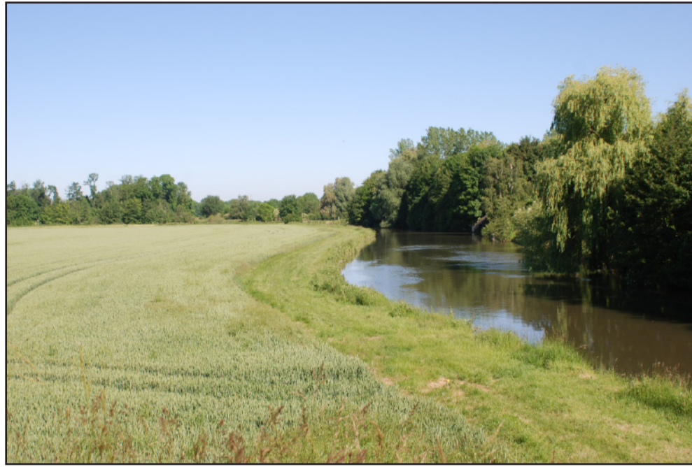
Pour augmenter au maximum la production agricole, la ripisylve du bord de l'Eure a été coupée. (2009 - commune de Chambray)