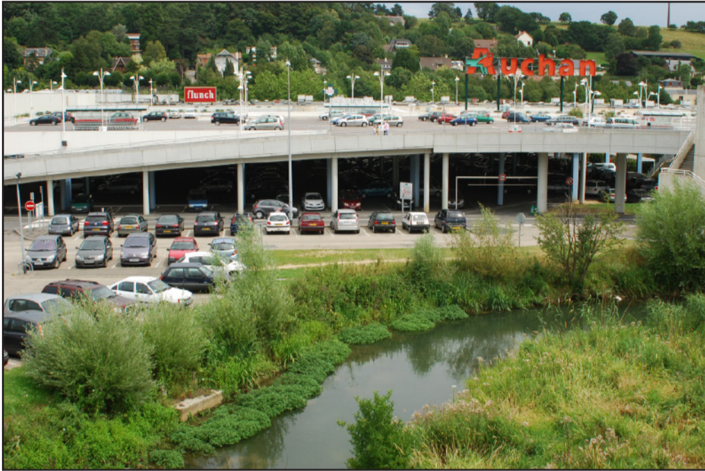
Les grandes surfaces recherchent les zones planes : dans les fonds de vallées, aux dépens des zones humides. (2009 - commune de Montivilliers)

Sur le littoral, le processus d'urbanisation des estuaires entraîne un basculement des paysages littoraux. Fragiles et contraints, les estuaires ne peuvent supporter que de petites extensions respectant l'échelle des coteaux.