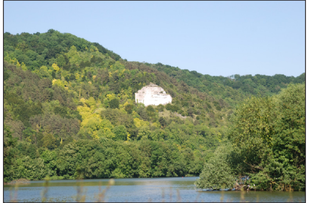
Coteau de la Seine entièrement boisé (Amfreville-sous-les-Monts).

L'abandon des cultures fruitières et du pastoralisme sur les coteaux conduit à une fermeture du paysage des vallées et à une homogénéité des coteaux.