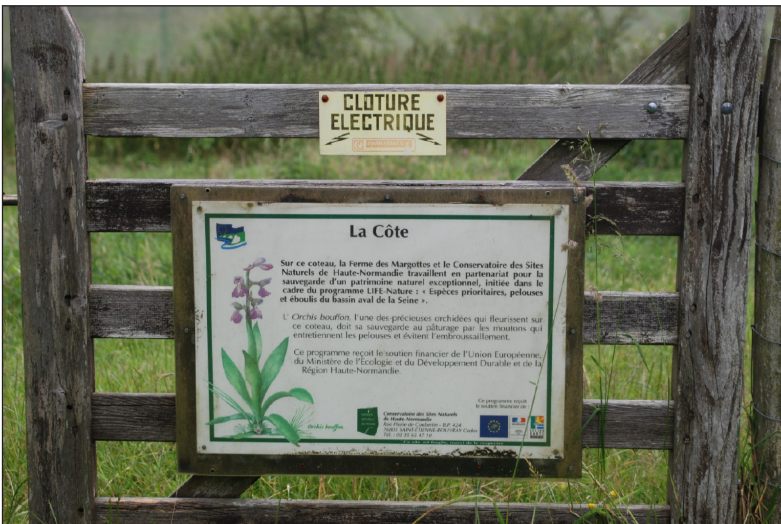
Emprise de pelouse calcaire protégée et gérée par le Conservatoire des Sites Naturels de Haute-Normandie.