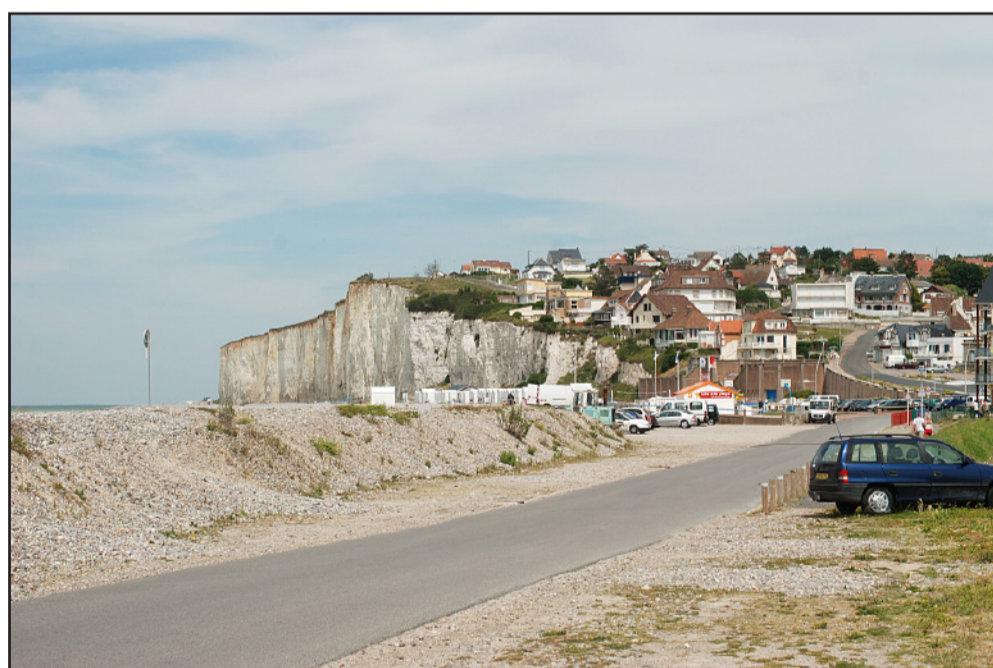
Une digue qui masque la vue sur le rivage pour protéger la route des assauts de la mer : ou comment oublier l'intérêt principal d'un bord de mer. (2009 - commune de Criel-sur-Mer)

Antérieurement, la poldérisation des estuaires et le busage des fleuves à leur embouchure auraient déjà eu pour effet de diminuer la surface des zones humides en Haute-Normandie.