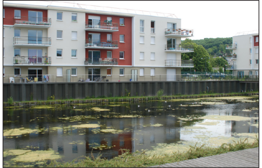
Dans les nouvelles opérations urbaines, la prise en compte de l'eau - bassin d'orage - n'est pas toujours très soignée. (2009 - commune de Dieppe)