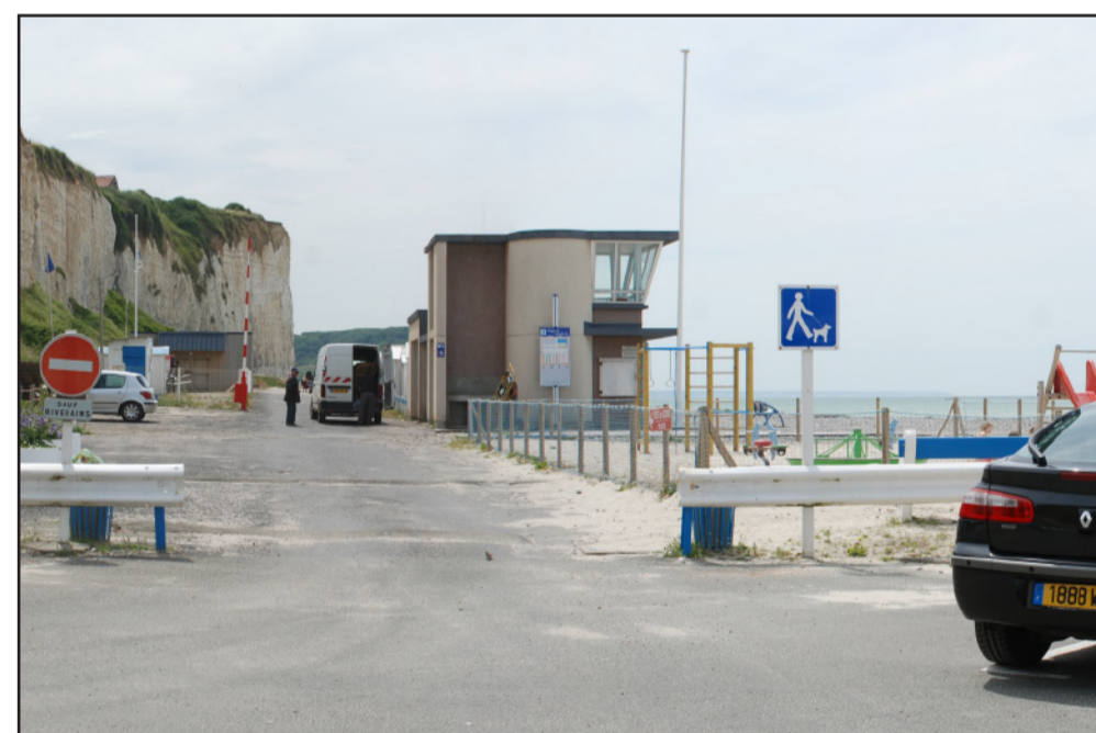
A Mesnil-Val, la route bitumée et le mobilier à caractère routier font oublier le paysage naturel de la plage et des falaises. (2009 - commune de Criel-sur-Mer)