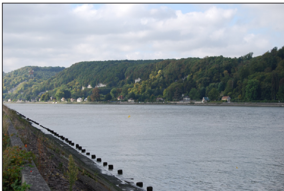
Des berges bétonnées pour une meilleure voie de navigation sur la Seine : un fleuve qui perd son aspect naturel. (2009 - commune de Sahurs)

Depuis la seconde guerre mondiale, les projets d'aménagement du littoral et de la Seine se sont multipliés et ont entraîné un bétonnage massif. Cela a eu pour effet de durcir ces paysages de l'eau.