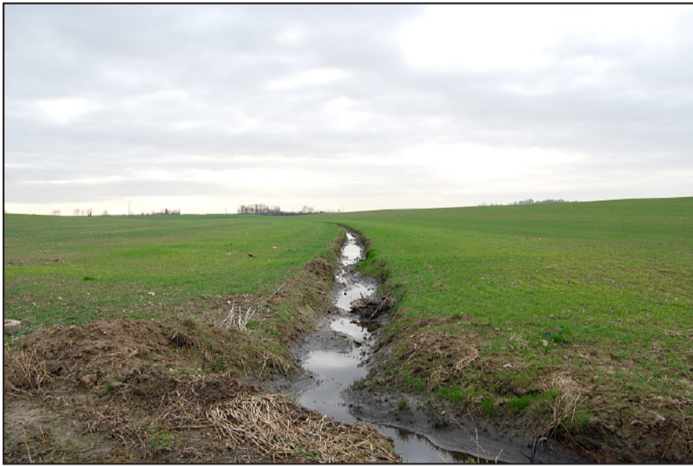
L'agriculture intensive va jusqu'à supprimer tous les cours d'eau pour les transformer en fossés drainants. (2009 - commune de Saussay-la-Campagne)

Les ripisylves et les zones humides subissent de nombreuses dégradations par le voisinage des espaces agricoles. Les marais sont drainés, les ripisylves sont supprimées, les cours d'eau sont réduits à de pauvres fossés. Ci-dessous, en face de Gaillon, les grandes cultures ne laissent que quelques mètres aux arbres pour s'épanouir.