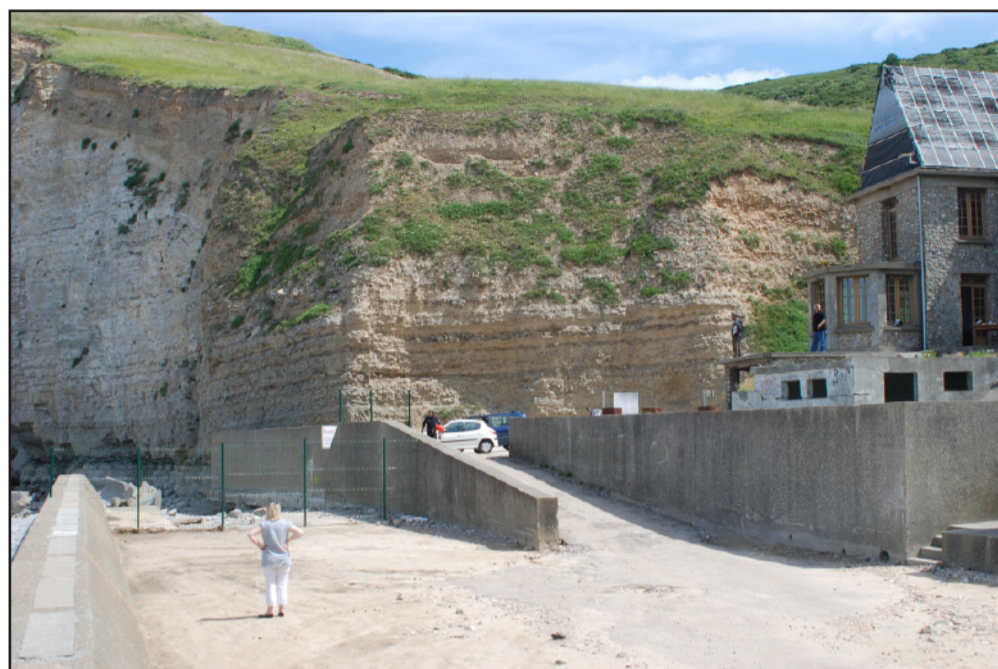
Des digues de béton toujours plus grandes pour protéger des constructions trop proches de la mer : qui mérite d'être protégé : le littoral ou la maison ? (2009 - commune de Bruneval)

Depuis la seconde guerre mondiale, les projets d'aménagement du littoral et de la Seine se sont multipliés et ont entraîné un bétonnage massif. Cela a eu pour effet de durcir ces paysages de l'eau.