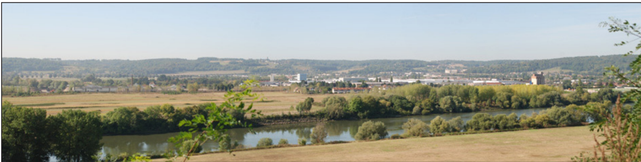
«Maigreur» des espaces naturels au bord de l'eau. (2009 - vue sur la commune de Gaillon)

Les ripisylves et les zones humides subissent de nombreuses dégradations par le voisinage des espaces agricoles. Les marais sont drainés, les ripisylves sont supprimées, les cours d'eau sont réduits à de pauvres fossés. Ci-dessous, en face de Gaillon, les grandes cultures ne laissent que quelques mètres aux arbres pour s'épanouir.