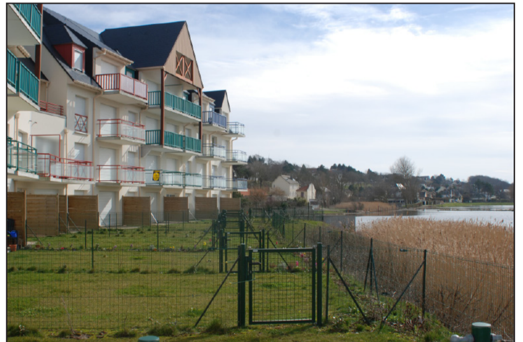
Remblaiement de la zone humide dans la vallée de Criel-sur-Mer. (2009 - commune de Criel-sur-Mer)