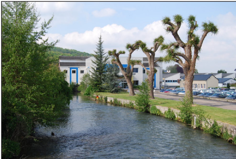
Bord de rivière peu valorisé dans la vallée de l'Andelle. (2009 - commune de Pont-Saint-Pierre)