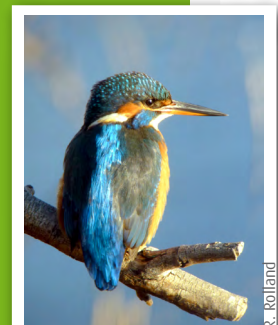
Martin-pêcheur ( Alcedo atthis )