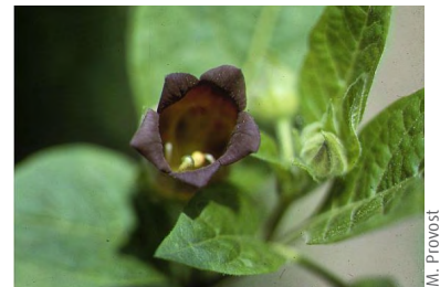
Belladone ( Atropa belladonna )