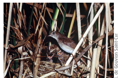
Bouscarle de Cetti ( Cettia cetti )

On observe toute l'année le Busard des roseaux.