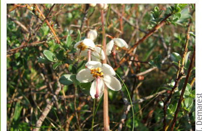
Pyrole des dunes ( Pyrola rotundifolia )