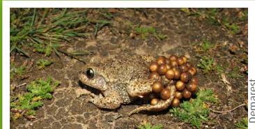
Crapaud accoucheur ( Alytes obstetricans )