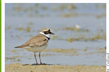
Petit gravelot ( Charadrius dubius )

Les secteurs de marais arrière-littoraux accueillent le Crapaud calamite et le Crapaud accoucheur, ainsi que plusieurs espèces d'oiseaux : Locustelle tachetée, Bruant des roseaux, petit Gravelot