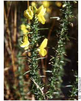
Ajonc de Le Gall ( Ulex gallii )

Les secteurs sablonneux accueillent le Chou marin, le Cranson d'Angleterre, la Spergulaire des marais, la grande Brize, l'Elyme des sables, l'Euphorbe des dunes, l'Orge maritime