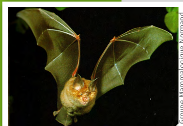
Grand Rhinolophe ( Rhinolophus ferrumequinum )