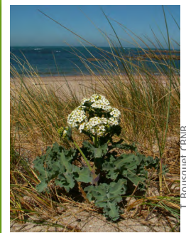
Chou marin ( Crambe maritima )