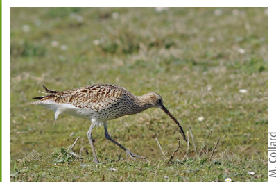
Courlis cendré (Numenius arquata)