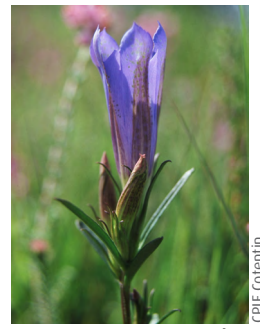
Gentiane pneumonanthe (Gentiana pneumonanthe)