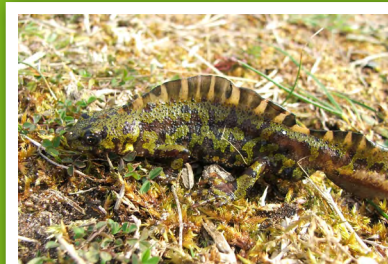
Triton marbré (Triturus marmoratus)