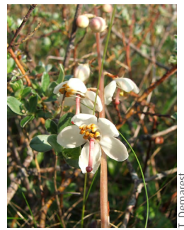
Pyrole à feuilles rondes (Pyrola rotundifolia)