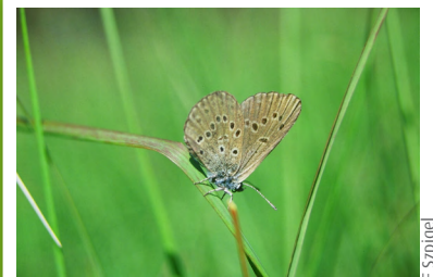
Azuré des mouillères (Phengaris alcon)

Azuré des mouillères, Sympétrum noir, Triton marbré, Rainette verte, Coronelle lisse, Courlis cendré, Engoulevent d'Europe, Fauvette pitchou... Reproduction : Sarcelle d'été, Canard souchet, Rousserole verderolle, Courlis cendré, Locustelle tachetée, Petit Gravelot, Mouette rieuse, Grèbe huppé, Busard des roseaux, Busard cendré, Grèbe castagneux, Héron cendré, Spatule blanche.