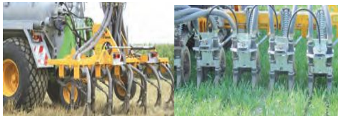
Système à disques en prairie Système à socs en cultures

L'injection vise à déposer le lisier dans une cavité formée sous la surface du sol. Le principe de la technique est de réduire le contact lisier/atmosphère en introduisant le lisier dans le sol.