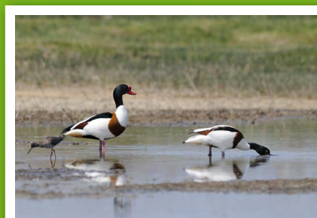
Tadorne de Belon ( adorna tadorna )

Limicoles et anatidés dont reproduction du Tadorne de Belon