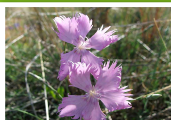
Œillet de France ( Dianthus hyssopifolius )