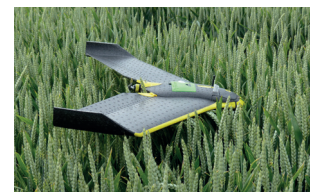
Innovation technologique (Drone)