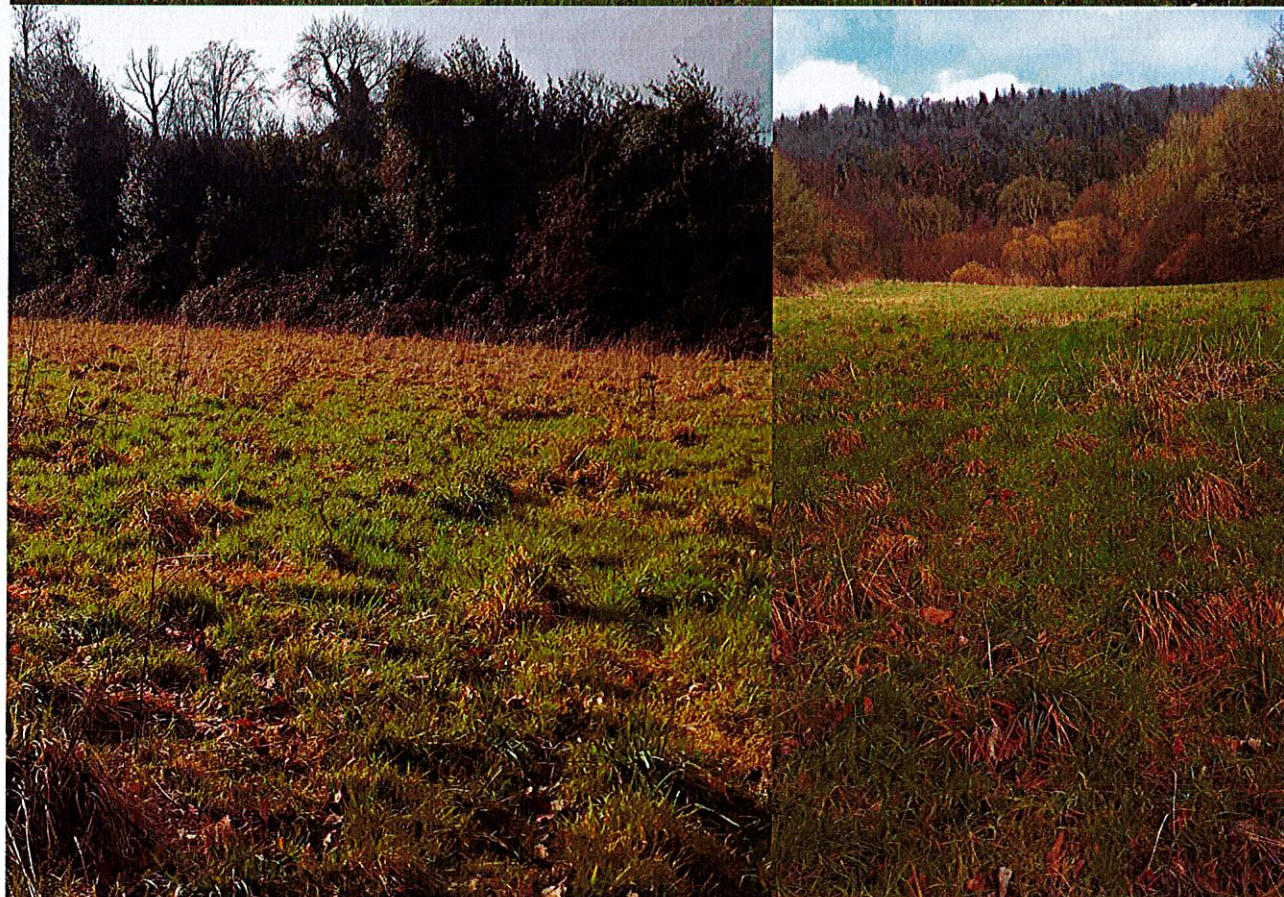
Vues externes des 3 prairies à partir de la RD n°6