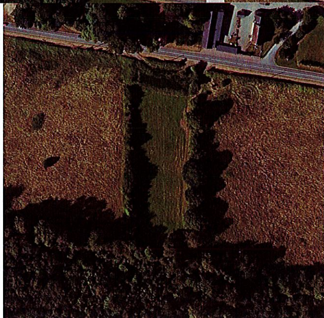
Vues aériennes