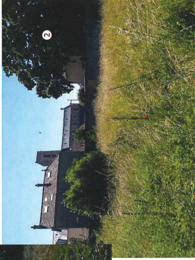
Vue de la friche existante à l'ouest du parking Carnot actuel (avril 2018)