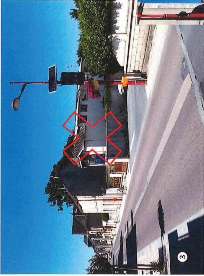
Bvd Carnot Sens Luc – Hermanville (avril 2018)