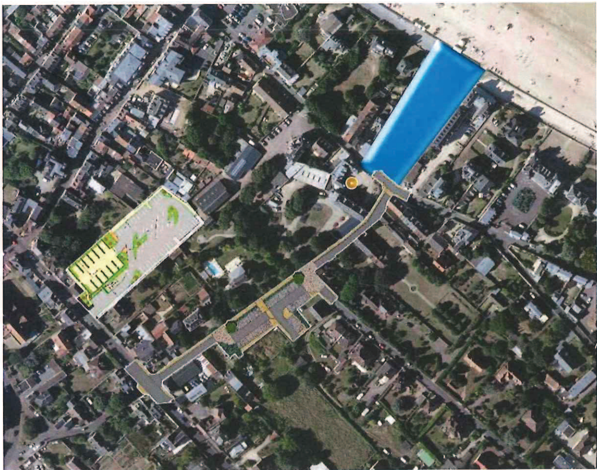
Plan de situation avec implantation des deux plans projets en cours