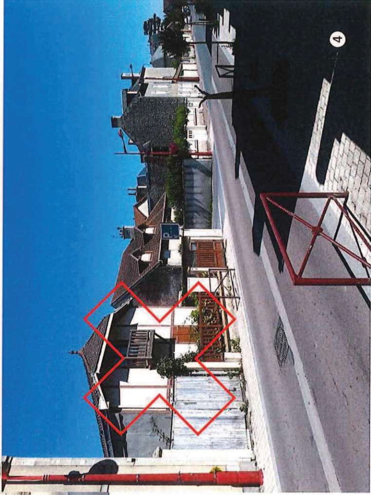
Bvd Carnot Sens Hermanville – Luc (avril 2018)