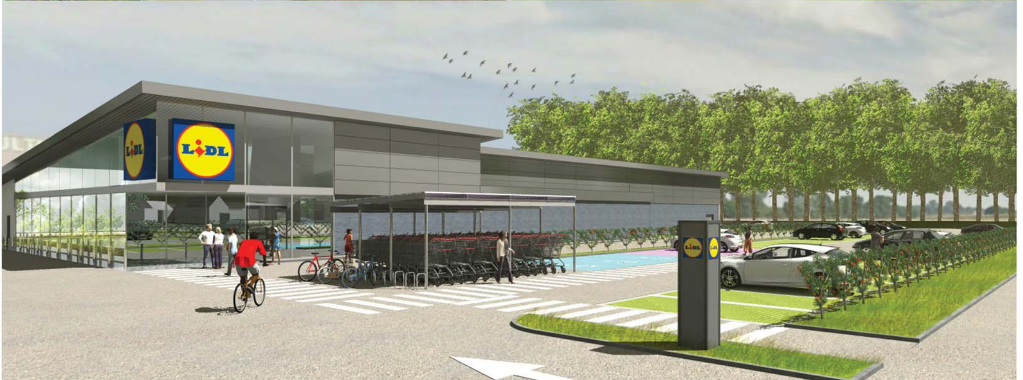
ANNEXE 4 - INSERTIONS DU PROJET