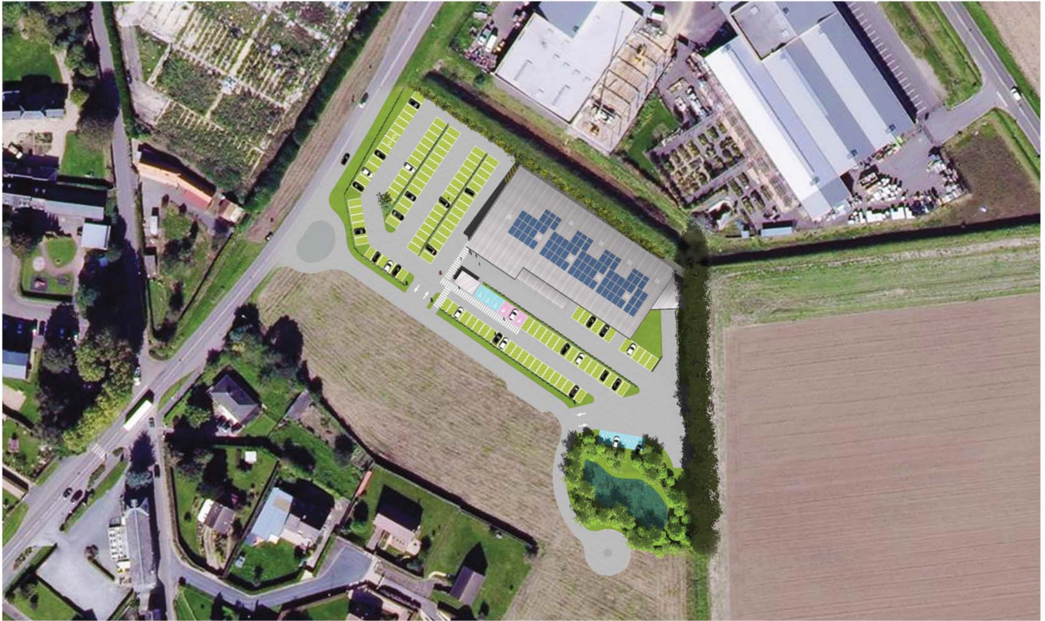
ANNEXE 4 - PLAN DU PROJET - Echelle 1.2000