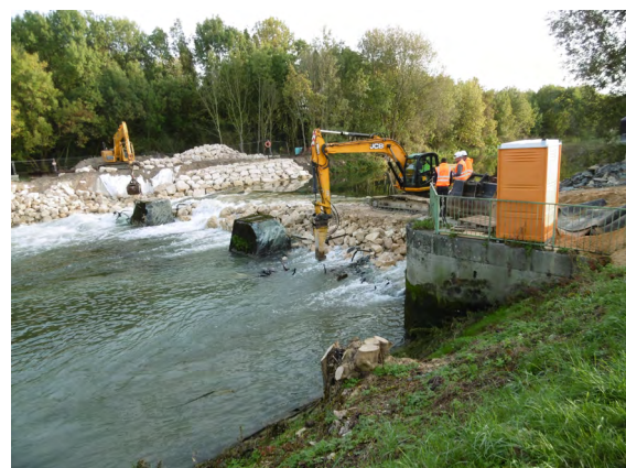
Travaux d'effacement du barrage de Martot