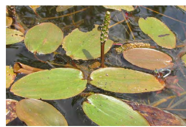
Potamot nageant (Potamogeton natans)