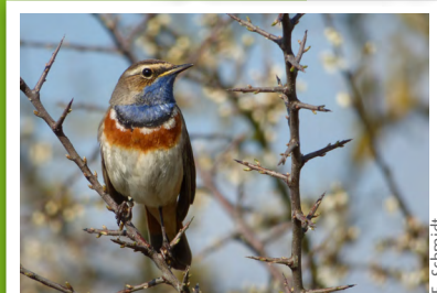
Gorgebleue à miroir ( Luscinia svecica )