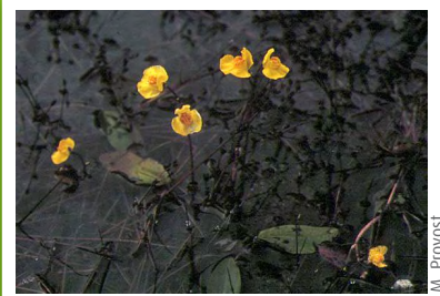
Utriculaire citrine ( Utricularia australis )