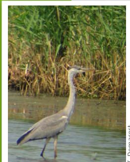
Héron cendré ( Ardea cinerea )