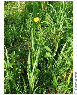
Grande douve ( Fasciola hepatica )