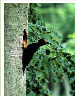
Pic noir ( Dryocopus martius )