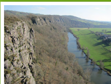
Rochers de Clécy

Le Triton marbré a été recensé dans les quelques secteurs humides.