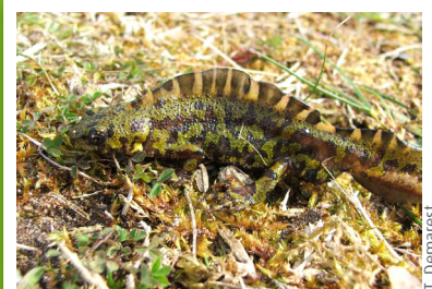
Triton marbré ( Triturus marmoratus )