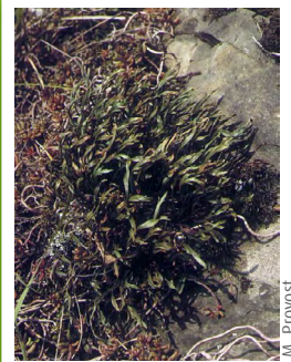
Catapode des graviers ( Micropyrum tenellum )