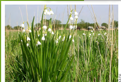
Nivéole d'été ( Leucojum aestivum )