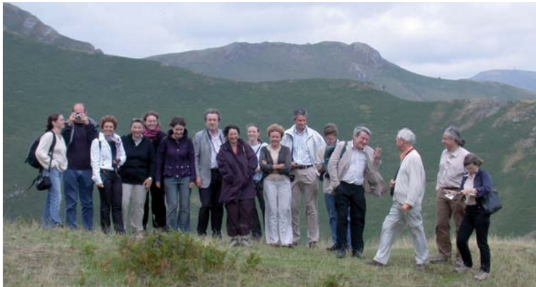
Atelier transfrontalier France-Espagne - 2006