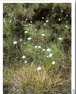
Linaigrette engainante ( Eriophorum vaginatum )