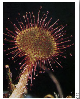
Rossolis à feuilles rondes ( Drosera rotundifolia )

On note au sein de certains boisements des suintements de sources, la physionomie de la végétation change alors en strate herbacée riche en fougères ( Pteridium aquilinum , Dryopteris dilatata , Blechnum spicant ) avec des tapis de sphaignes et la luzule des bois* et la Prêle des bois*.