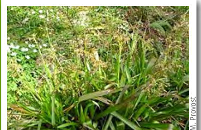
Millepertuis des marais ( Hypericum elodes )