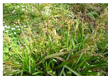
Luzule des bois ( Luzula sylvatica )