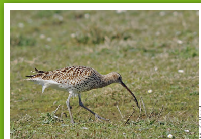
Courlis cendré ( Numenius arquata )