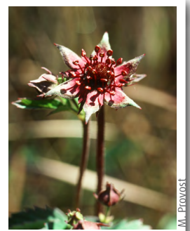
Comaret ( Comarum palustre )

Oenanthe à feuilles de silaus ( Oenanthe silaifolia ), le Comaret ( Comarum palustre ), le Plantain d'eau lancéolé ( Alisma plantago lanceolatum ) et Wolffia arrhiza