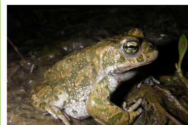
Crapaud calamite ( Epidalea calamita )

Crapaud calamite, Crapaud accoucheur, Triton ponctué Oiseaux reproducteurs : Sarcelle d'été, Canard colvert, Râle d'eau, Bruant des roseaux. Nombreux oiseaux d'eau en escale hivernale