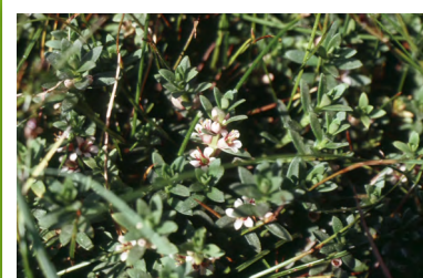
Glaux maritime ( Glaux maritima )

Grenouillette de Baudot, Grenouillette à feuilles capillaires, Grenouillette aquatique, Grenouillette peltée, Zannichellie des marais, Scirpe maritime, Glaux maritime, Jonc de Gérard, Jonc des chaisiers, Samole de Valerand, Lotier à feuilles étroites, Bugrane épineuse