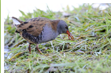
Râle d'eau ( Rallus aquaticus )