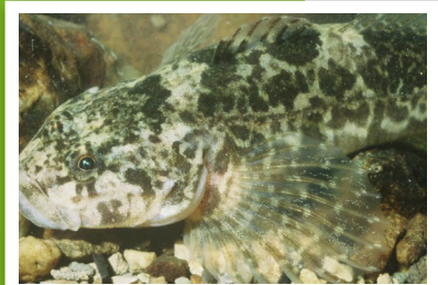
Chabot ( Cottus gobio )