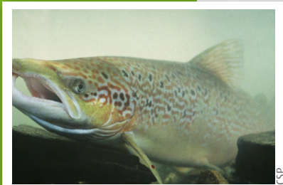
Saumon atlantique ( Salmo salar )