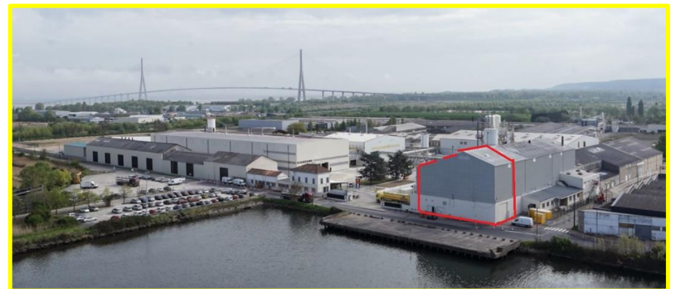
Emplacement atelier de synthèse – Mai 2020