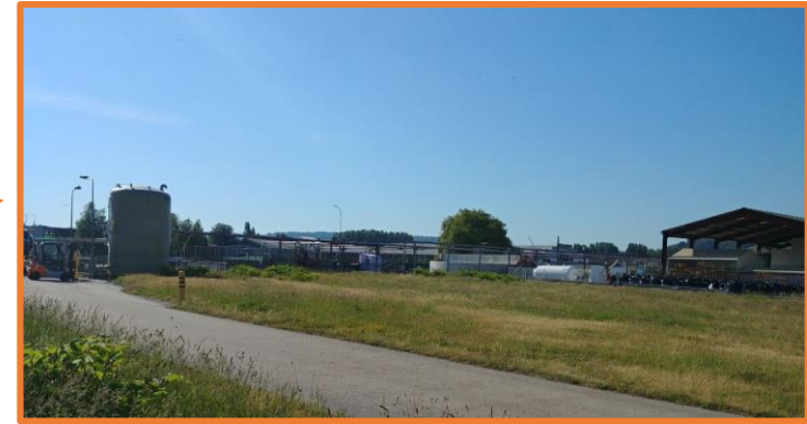
Emplacement du stockage de soude (vue proche) – Mai 2020