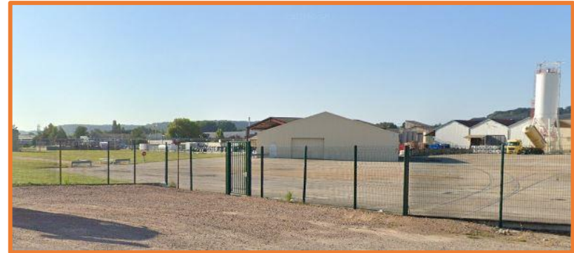
Emplacement du stockage de soude (vue éloignée) – Juillet 2019