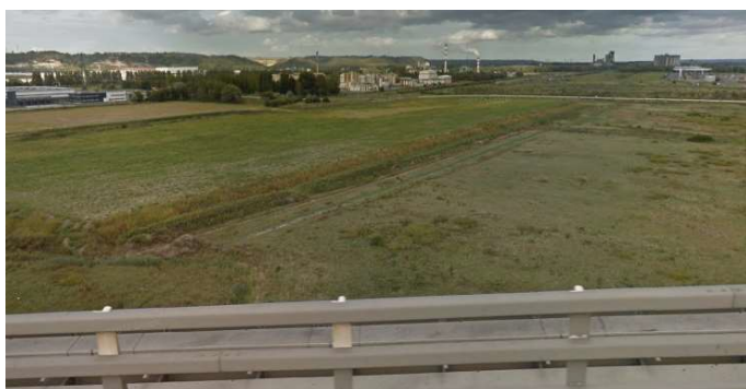
Vue vers l'est prise depuis l'autoroute A29