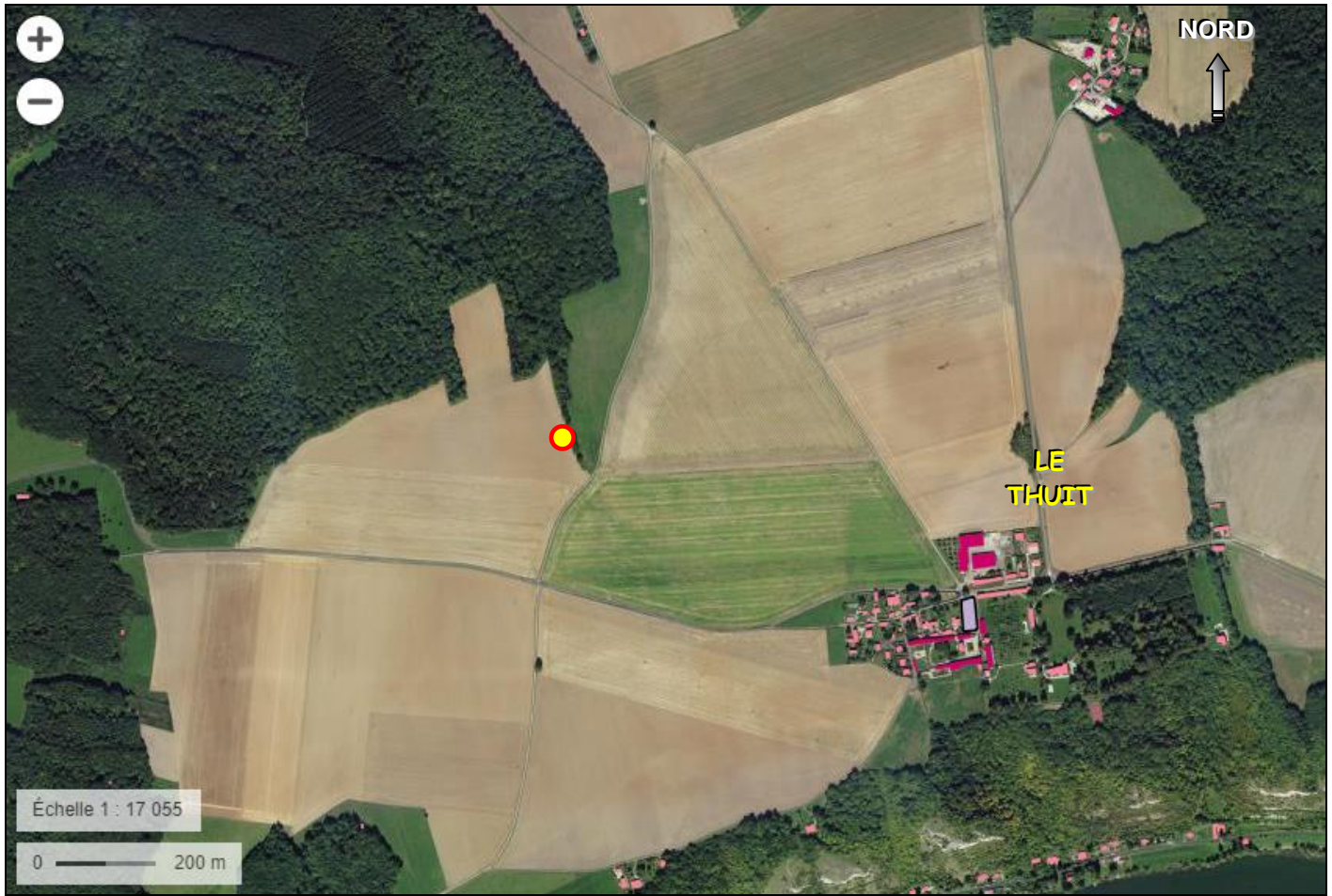
Positionnement sur photographie aérienne de l'IGN du forage par rapport aux installations existantes