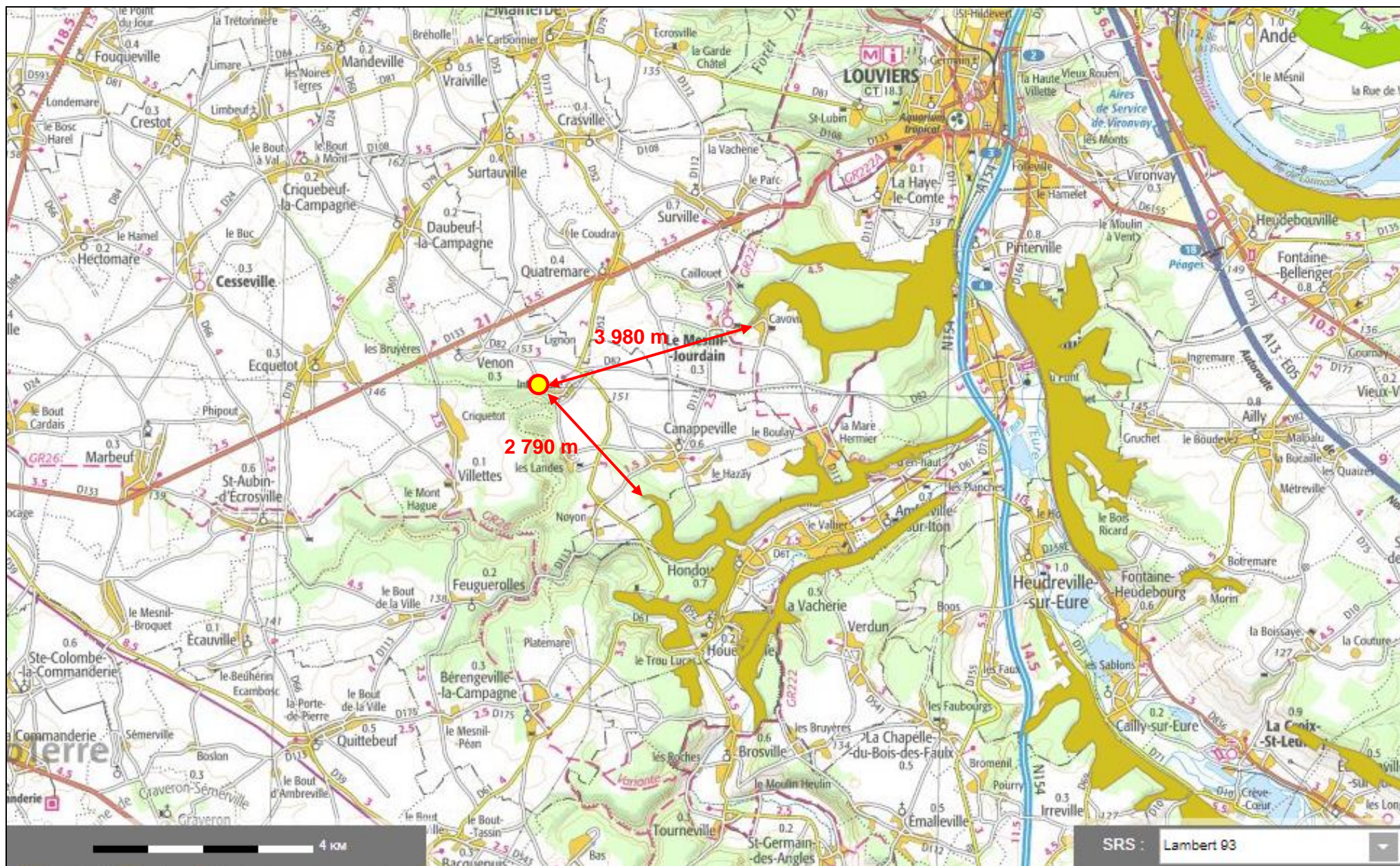
Situation du forage projeté par l'E.A.R.L. DES BUISSONNETS à LA FOSSE AU GROS (VENON - 27) par rapport aux NATURA 2000 (Extrait de : infoterre.brgm.fr)