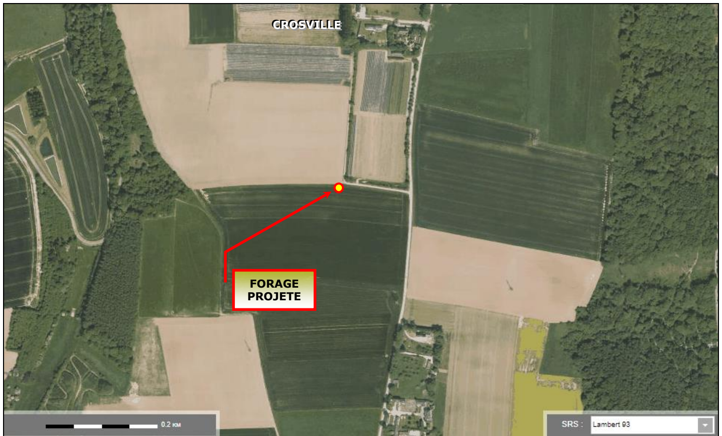
Situation du forage projeté au lieu-dit de LA PLAINE DU CAMPVAL (VITTEFLEUR – 76) sur photographie aérienne de l'IGN (Extrait du site : geoportail.gouv.fr )