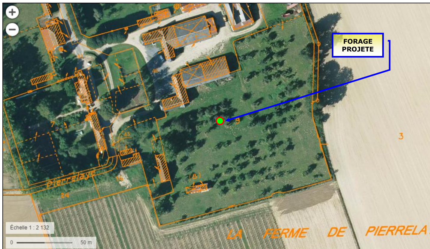
Situation du forage projeté à BEAUMONTEL (27) sur photographie aérienne de l'IGN avec figuration du parcellaire cadastral (Extrait du site : geoportail.gouv.fr)