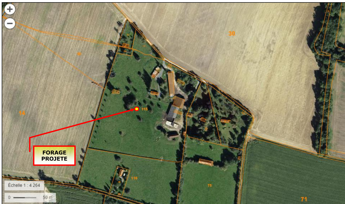
Situation cadastrale du forage projeté au BOULAY (LA TRINITE-DE-REVILLE – 27)

(Extrait des sites : geoportail.gouv.fr + cadastre.fr )