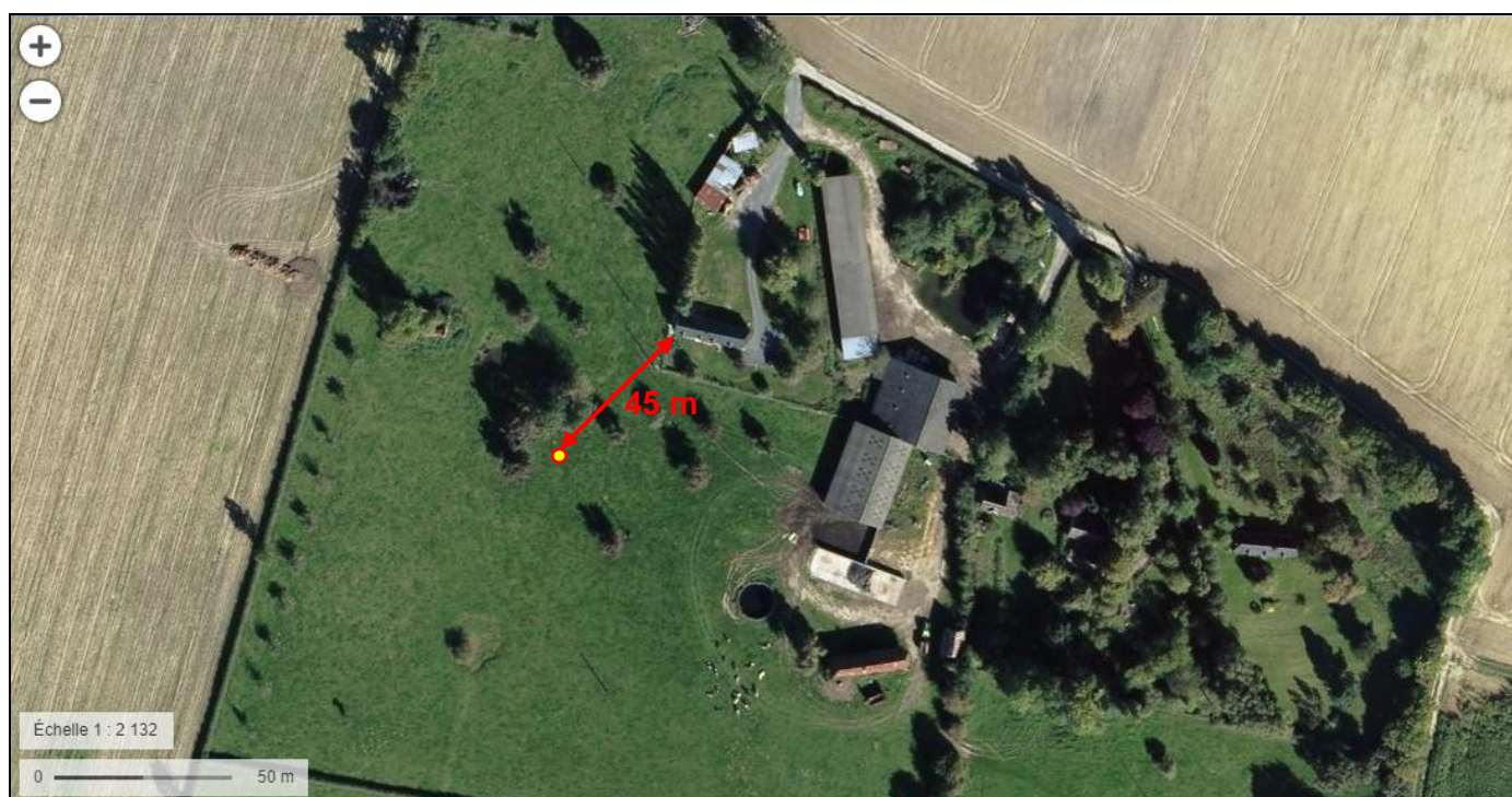
Situation sur photographie aérienne du forage projeté au BOULAY (LA TRINITE-DE-REVILLE – 27)

(*) L'extrait cadastral n'est pas disponible actuellement sur le site : cadastre.gouv.fr (maintenance informatique ?)