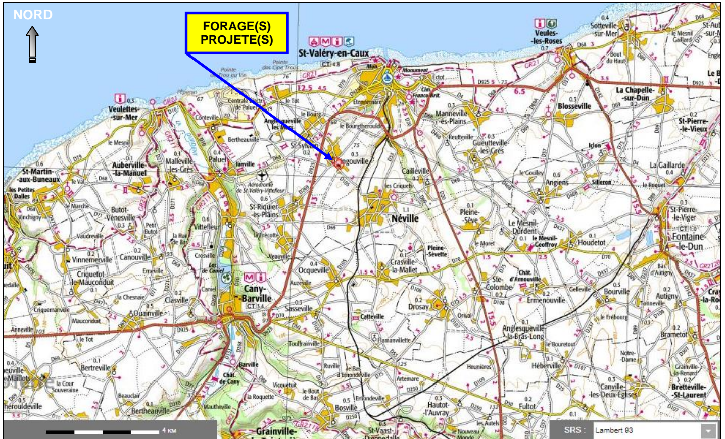
Situation des ouvrages projetés à INGOUVILLE (76) sur un extrait de carte de l'IGN à 1/100 000°