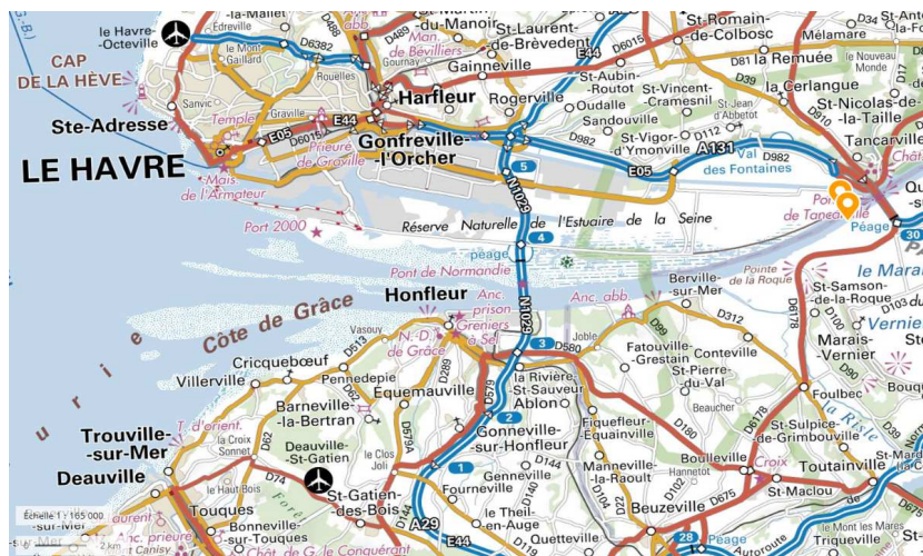
Illustrations 1, 2 et 3 : Coupe de principe du micro-tunnelier (extrait du dossier) ; plan du projet (extrait du dossier) et localisation du projet (carte IGN, Géoportail)