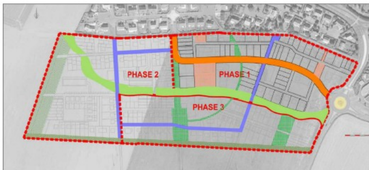
Plan de principe de découpage des trois phases

Le projet dans sa globalité s'organise autour d'un axe constituant un véritable cordon forestier, constituant la partie centrale du futur quartier. Ce cordon imaginé comme un parcours paysager, est constitué de 4 espaces forestiers différents : la forêt jardinée, la forêt humide, la forêt dense et la forêt agricole. Ils sont reliés entre eux par un cheminement pour les piétons et les cyclistes. Pour la phase 1, la surface de ce