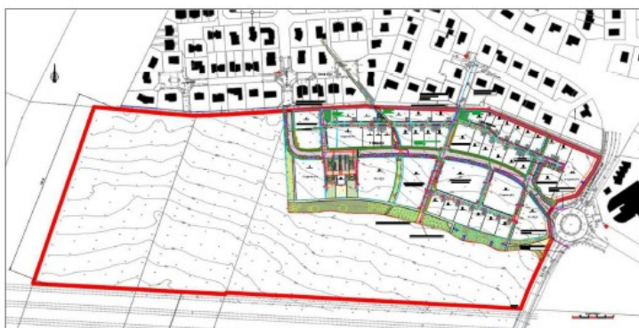
Plan masse de la phase n°1 d'aménagement représenté à l'échelle du projet global d'urbanisation