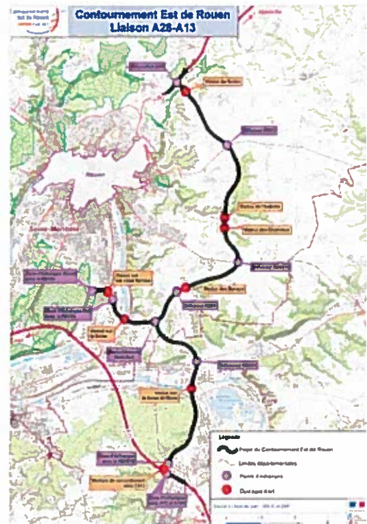
Figure 2 : Projet de liaison A28-A13

Postérieurement à la réalisation du projet, la collectivité compétente en matière d'urbanisme sur le territoire communal, pourra reprendre son document ainsi modifié afin de reclasser les espaces inclus