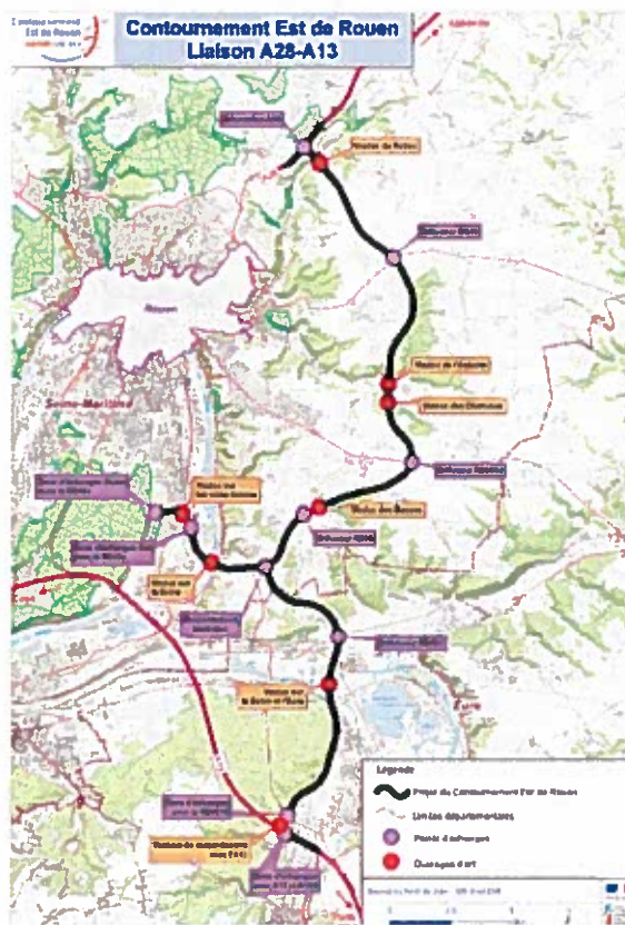
Figure 2: Projet de liaison A28-A13

À l'issue de la procédure de mise en compatibilité telle que décrite aux articles L 153-54 à 59 (ancien L 123-14-2) du code de l'urbanisme, la signature de l'acte déclarant l'utilité publique emporte modification des évolutions apportées au PLU.