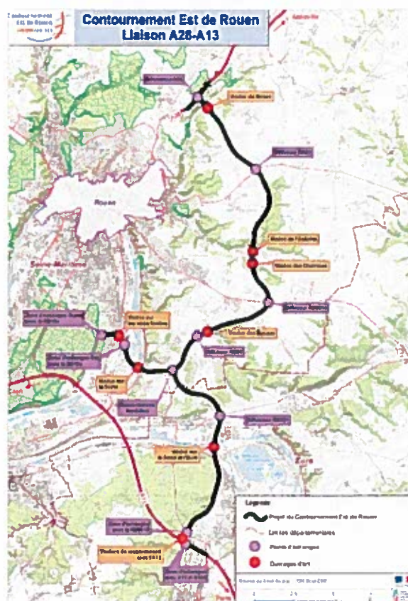
Figure 2 : Projet de liaison A28-A13

À l'issue de la procédure de mise en compatibilité telle que décrite aux articles L 153-54 à 59 (ancien L 123-14-2) du code de l'urbanisme, la signature de l'acte déclarant l'utilité publique emporte modification des évolutions apportées au PLU.