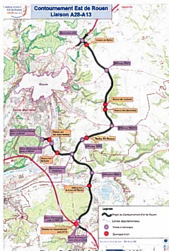
Figure 2 : Projet de liaison A28-A13

Postérieurement à la réalisation du projet, la collectivité compétente en matière d'urbanisme sur le territoire communal, pourra reprendre son document ainsi modifié afin de reclasser les espaces inclus dans cette bande EPDUP, laissés hors emprise du projet.