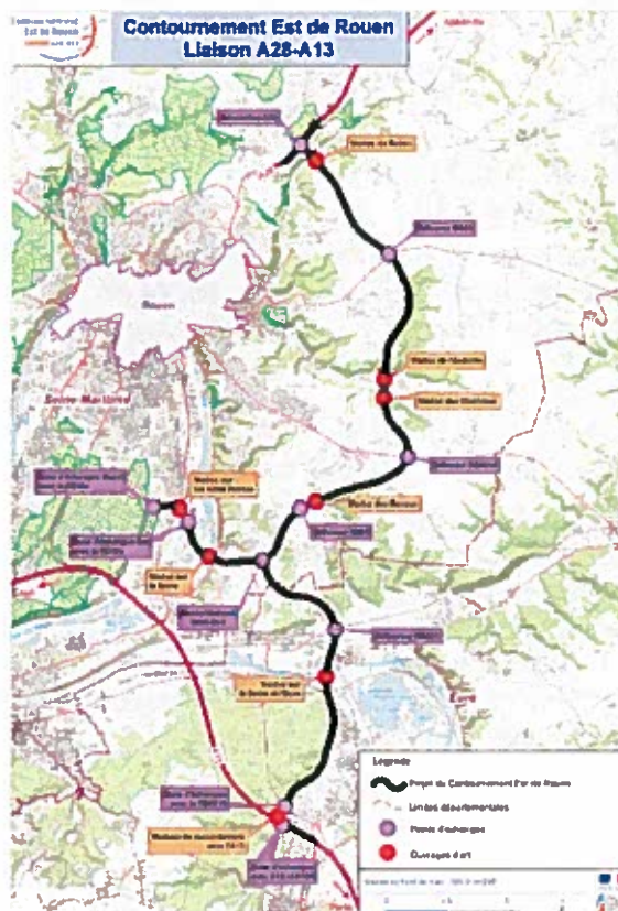
Figure 2: Projet de liaison A28-A13

À l'issue de la procédure de mise en compatibilité telle que décrite aux articles L 153-54 à 59 (ancien L 123-14-2) du code de l'urbanisme, la signature de l'acte déclarant l'utilité publique emporte modification des évolutions apportées au PLU.