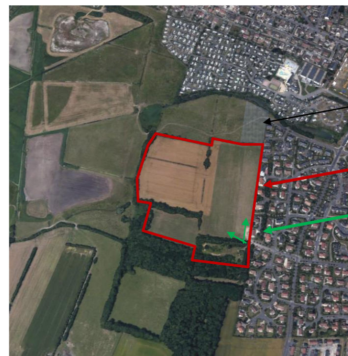
Vue aérienne – extrait google earth – sans échelle