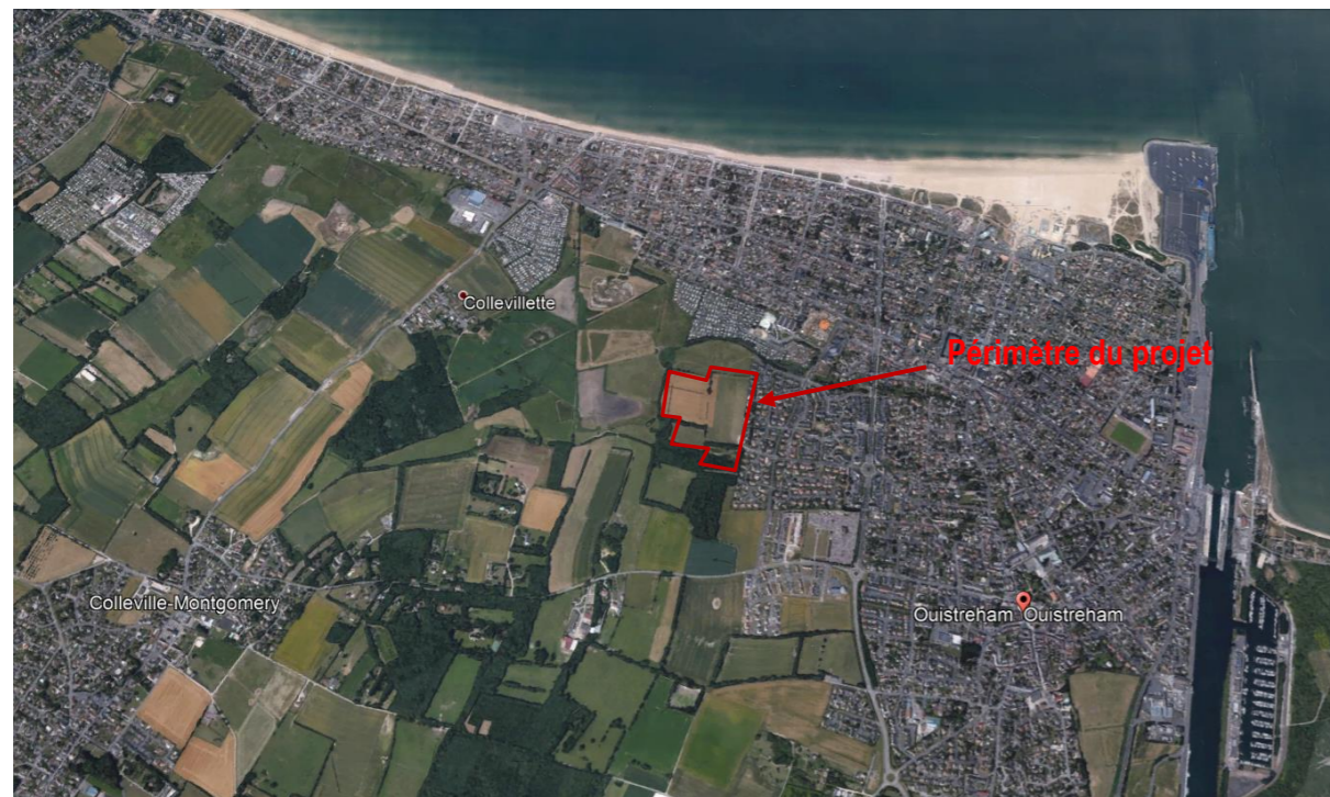
Vue aérienne – extrait google earth – sans échelle