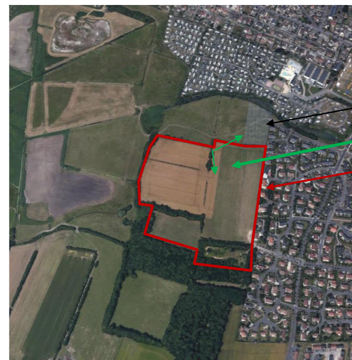
Vue aérienne – extrait google earth – sans échelle

zone bâtie en 2017 – avant la prise de vue aérienne