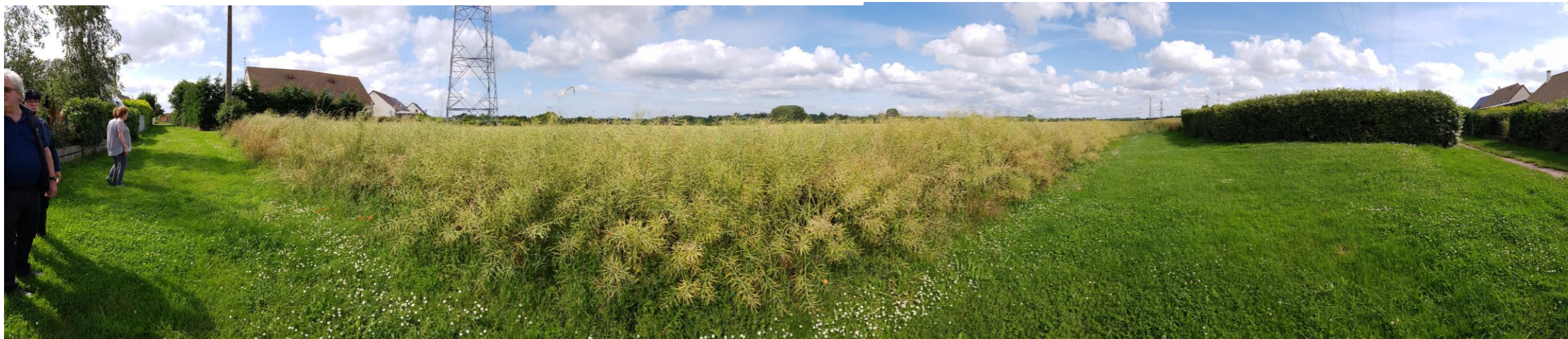
Photographie 4 Depuis les abords franges construites en direction du site