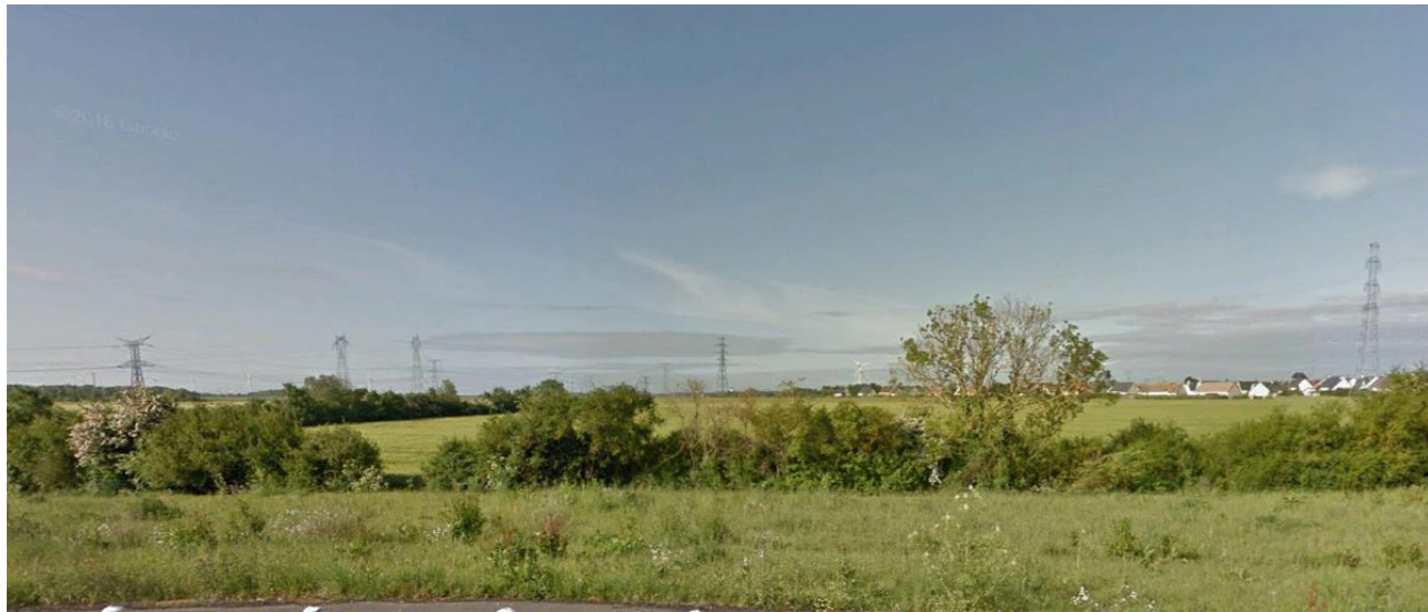
Photographie 2 Depuis le carrefour giratoire en direction du site (2018)