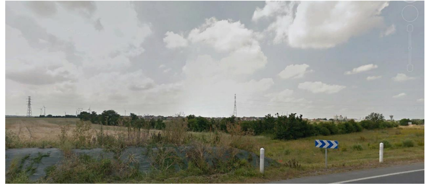
Photographie 3 Depuis la RD en direction du site