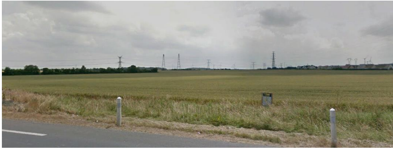
Photographie 1 Depuis la RD en direction du site(2018)