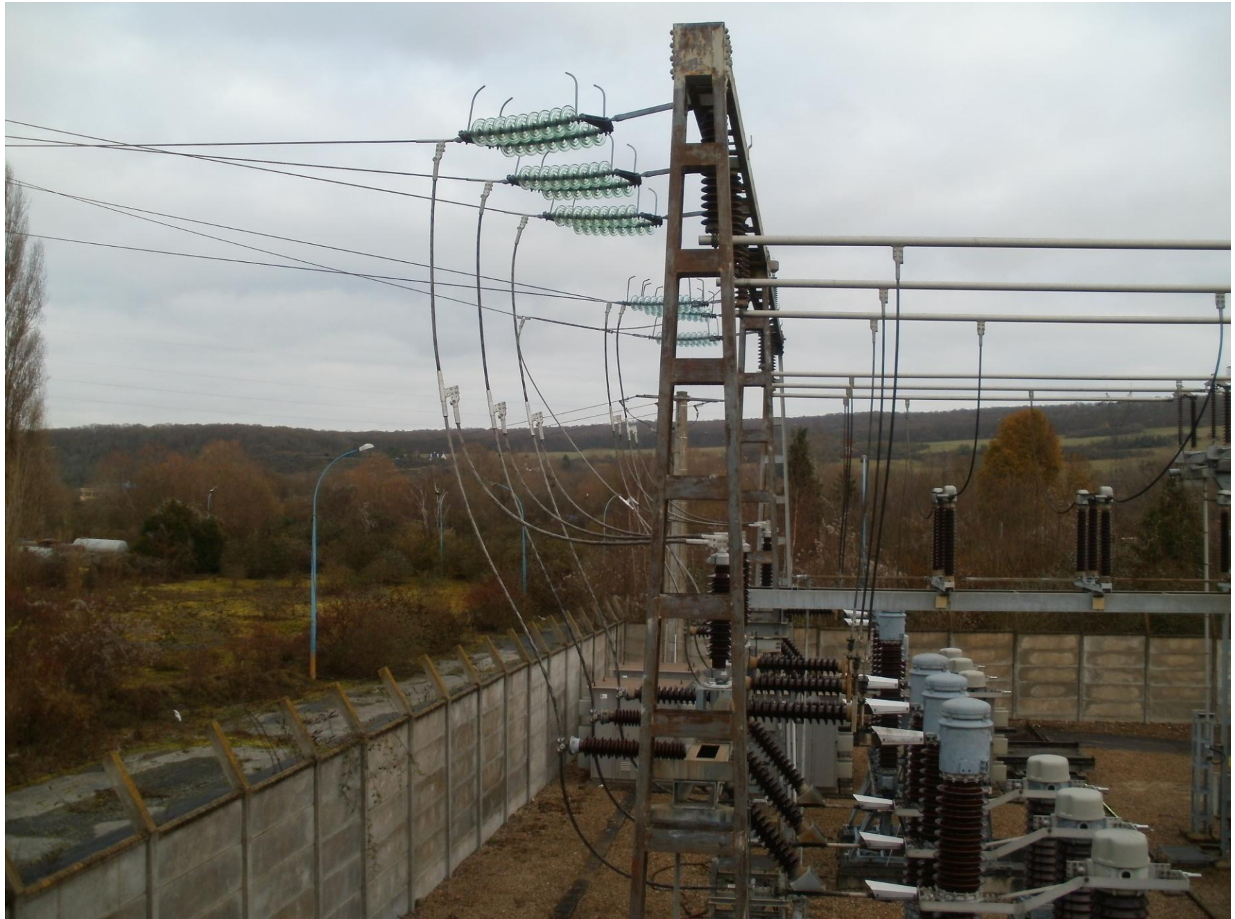
Photo 3 : Vue des arrivées haute tension 90kV depuis le toit du bâtiment industriel existant (10/12/2012)