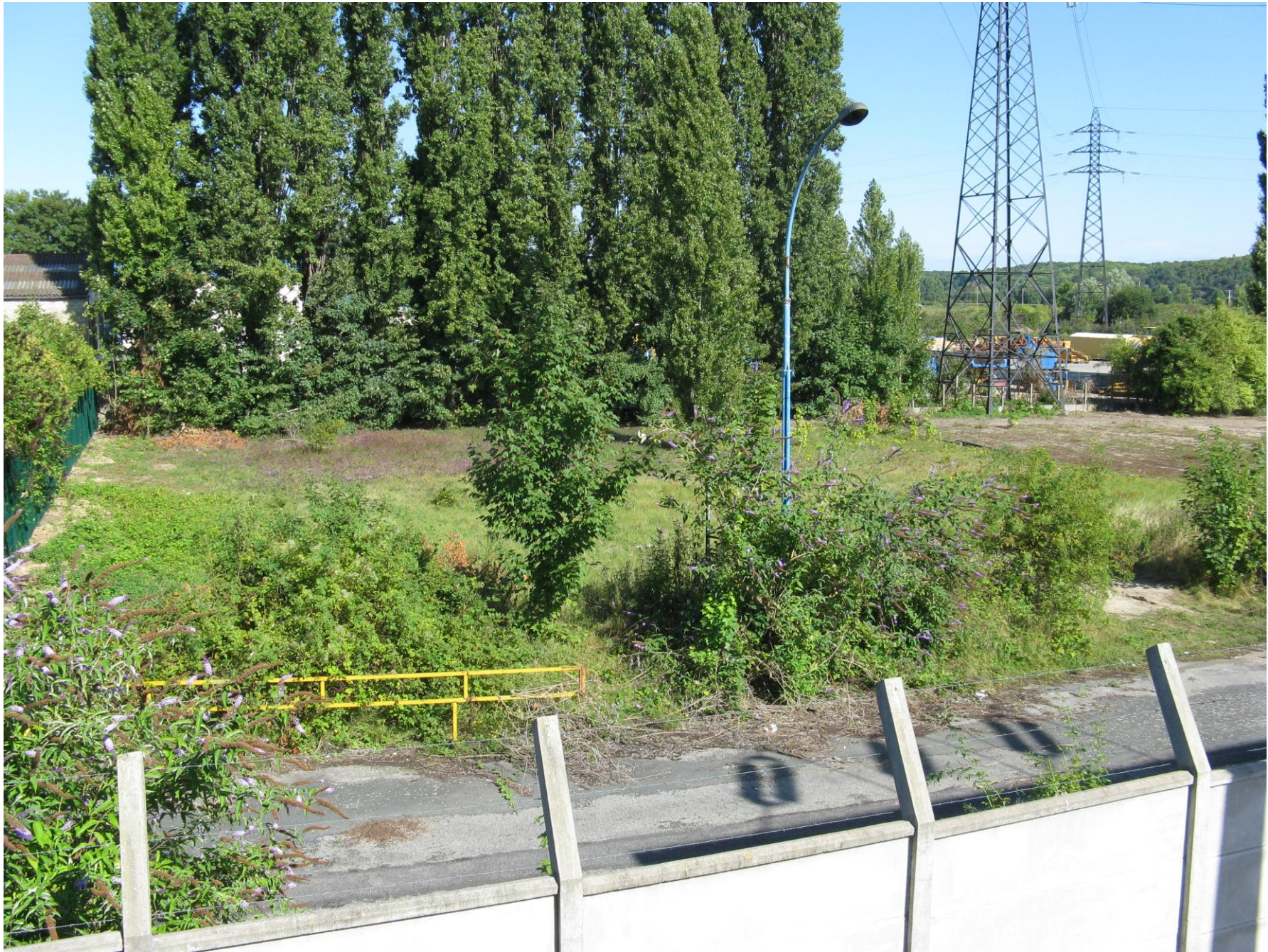
Photo 4 : Vue du terrain acquis en 2013 pour extension depuis le toit du bâtiment industriel existant (07/12/2012)