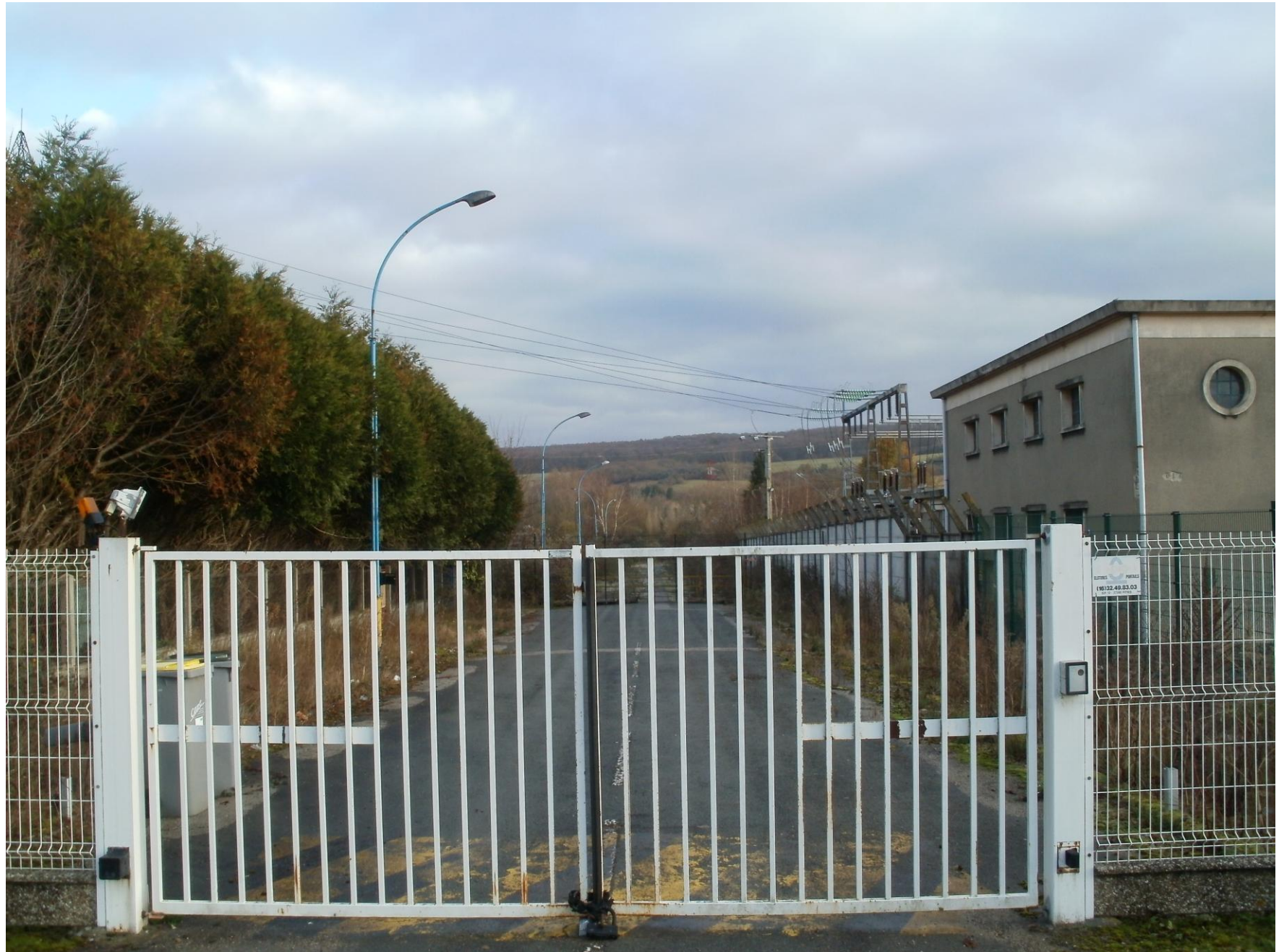
Photo 2 : Vue du terrain acquis en 2013 pour extension depuis la route (10/12/2012)