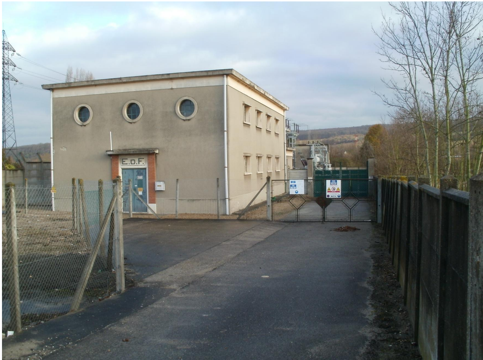
Photo 1 : Vue du poste électrique existant depuis la route (10/12/2012)