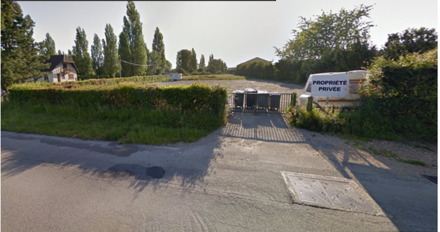
LOCALISATION DE LA VUE 1 :