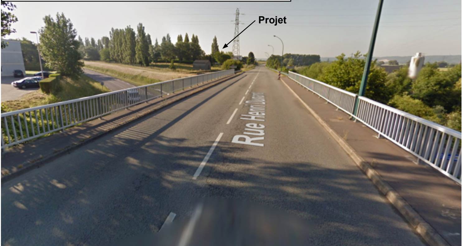
LOCALISATION DE LA VUE 1 :