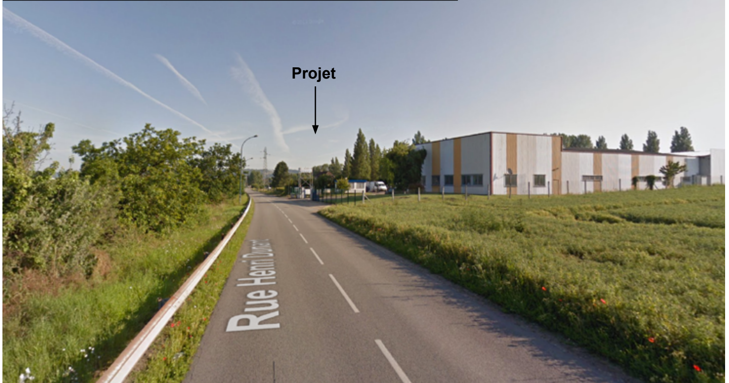
LOCALISATION DE LA VUE 3 :