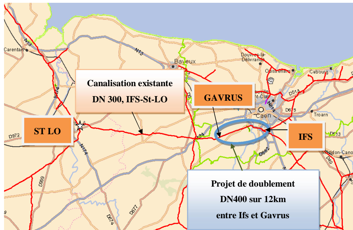
Figure 1 : Localisation du projet dans la région Normandie

La mise en service de ce nouvel ouvrage est prévue en fin 2021. Il sera construit et exploité conformément aux prescriptions techniques applicables aux canalisations de transport de GRTgaz en application de l'arrêté ministériel du 5 mars 2014 modifié.