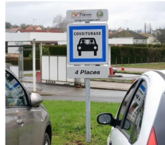
Aire de covoiturage sur un Intermarché (58)