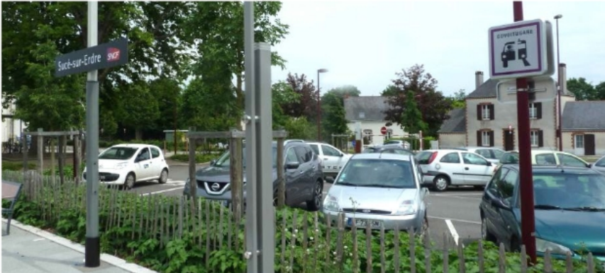
Stationnement "covoitugare" (covoiturage pour les usagers de la gare)