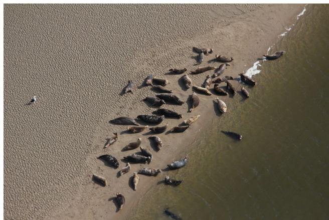
Groupe de phoques gris ( Halichoerus grypus ), sur les 46 observés en baie des Veys en septembre 2022