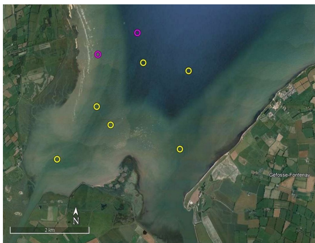
Localisation des phoques (veau-marin en jaune et phoque gris en fuschia) à marée basse en baie des Veys, le 6 septembre 2022

Les reposoirs de basse mer sont situés au cœur de l'estuaire, le long des chenaux et notamment sur les berges du chenal de Carentan et, dans une moindre mesure, sur celles du chenal d'Isigny.