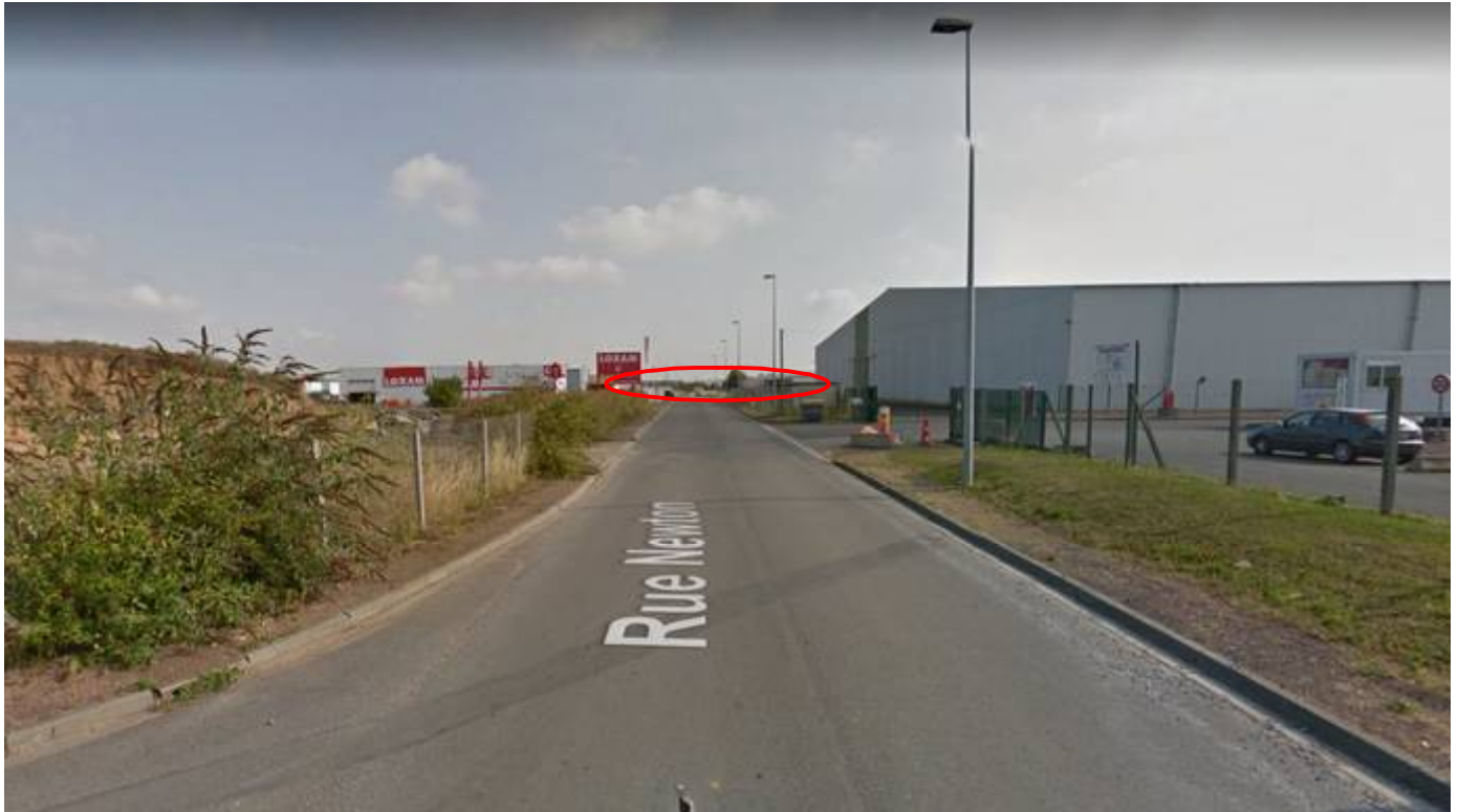
Photo N°1 : Vue du terrain dans son environnement lointain depuis la rue Newton