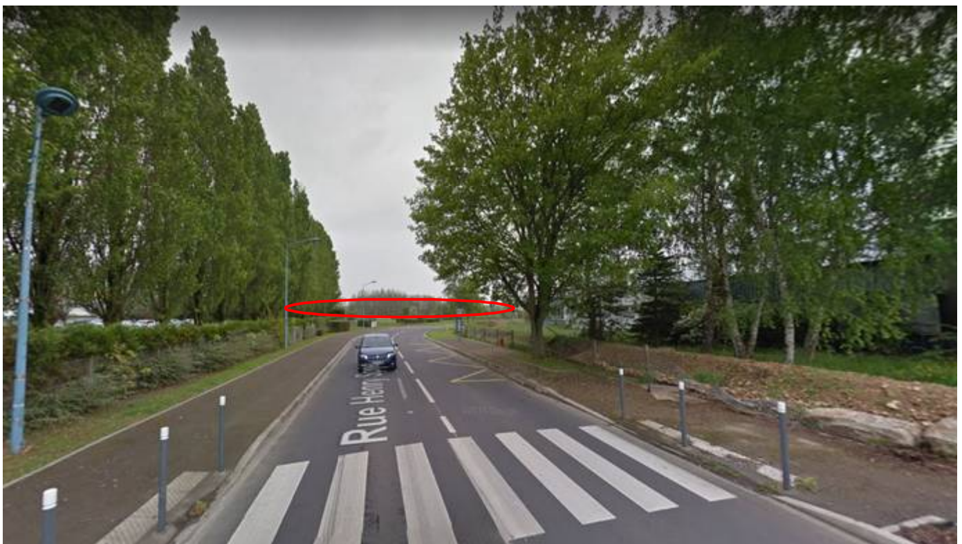
Photo N°2 : Vue du terrain dans son environnement lointain depuis la rue Henry Spriet.