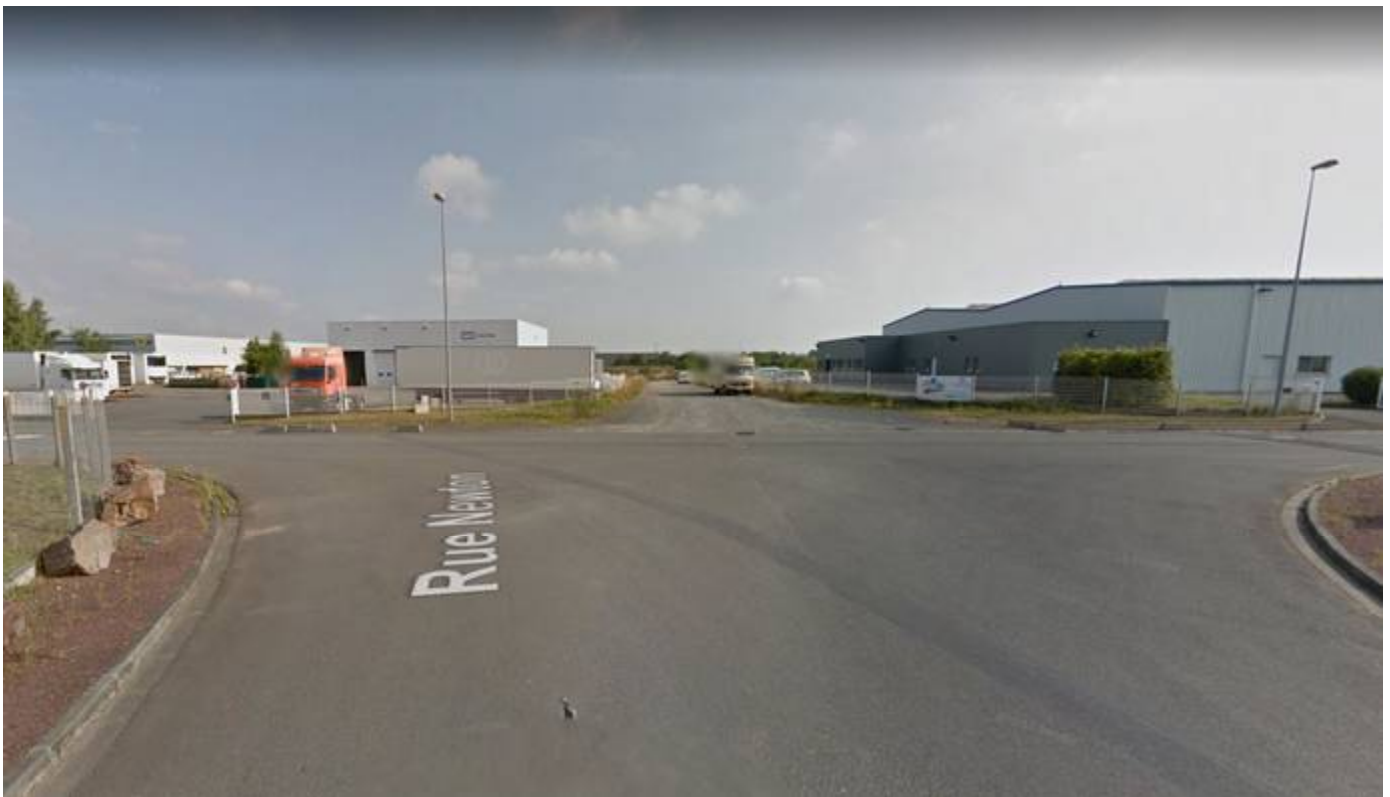
Photo N°4 : Vue du terrain dans son environnement proche depuis le carrefour des rues Newton/Niepce (Accès Ouest).