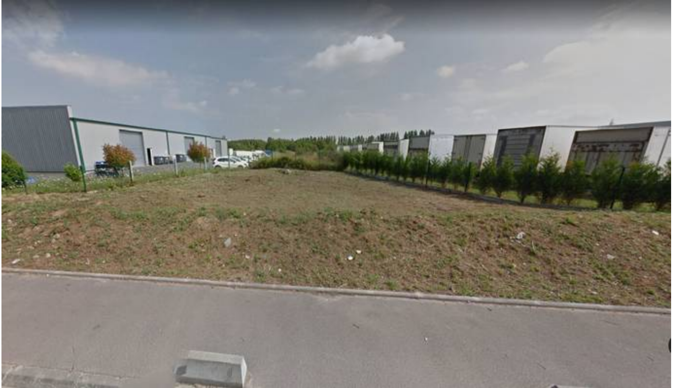
Photo N°3 : Vue du terrain l'entrée dans son environnement proche depuis la rue Niepce (Accès Est)